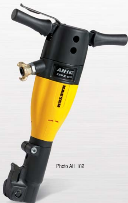
Photo AH 182

plus puissants, plus silencieux, moins de vibrations