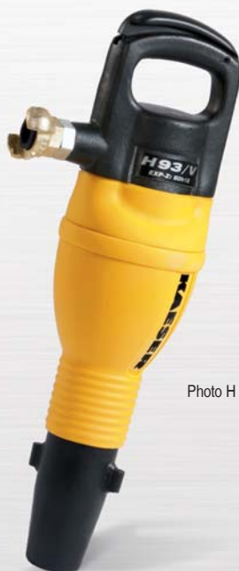
Photo H 93 V